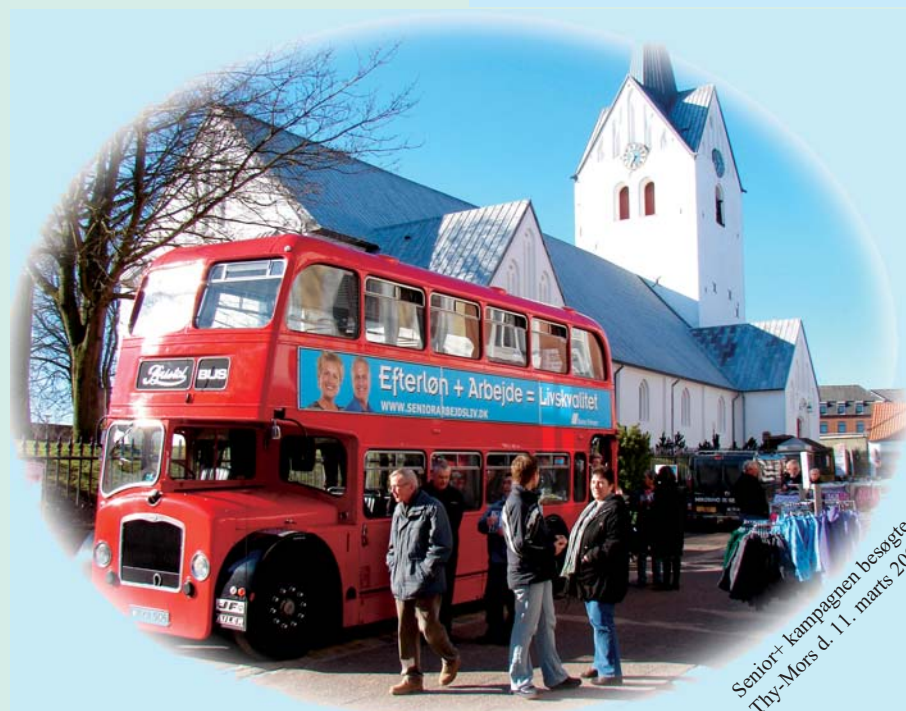
Senior+ kampagnen besøgte Thy-Mors d. 11. marts 2009

250.000 folkepensionister vil gerne være aktive på arbejdsmarkedet og 30.000 efterlønnere og 15.000 førtidspensionister vil gerne have et arbejdsliv.