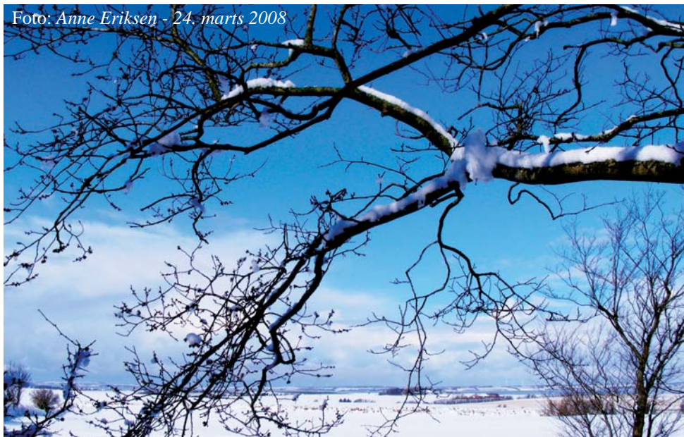
24. marts 2008

Her er et par af mine idéer: Debataften/eftermiddage om Thy-Mors’ erhvervsudvikling med repræsentanter fra Jobcenter, erhvervsråd, arbejdsgivere, kommunal- og regionsrådspolitikere, SETM-medlemmer med f.eks. flg. emner: Hvilke jobområder/arbejdspladser skal der satses på i de kommende år i Thy-Mors området? Hvad kan Senior Erhverv bidrage med? Kan vi sammen (op)finde nye jobs? Fremtidsværksted om jobskabelse i området. eftermiddage med vejledning i og