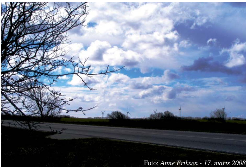
17. marts 2008

Referat og beretning finder du på hjemmesiden i arkivet.